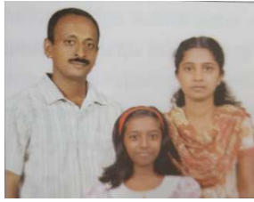
ജിജി - ഷാന്റി കുടുംബം

D.O.B.30.10.1999) ജനിച്ചു. എമിലിൻ B.Tech (electronics) ബിരുദധാരിയാണ്. ജിജി 29.09.2013 നിര്യാതനായി.